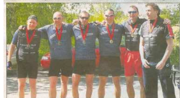
Ein stolzes Team nach einem harten Rennen: Medaillen zur Belohnung und als Anerkennung für die erbrachte Leistung.