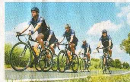
Die wahren Könige der Landstraße. Rund 100 Kilometer werden pro Trainingsausfahrt absolviert.