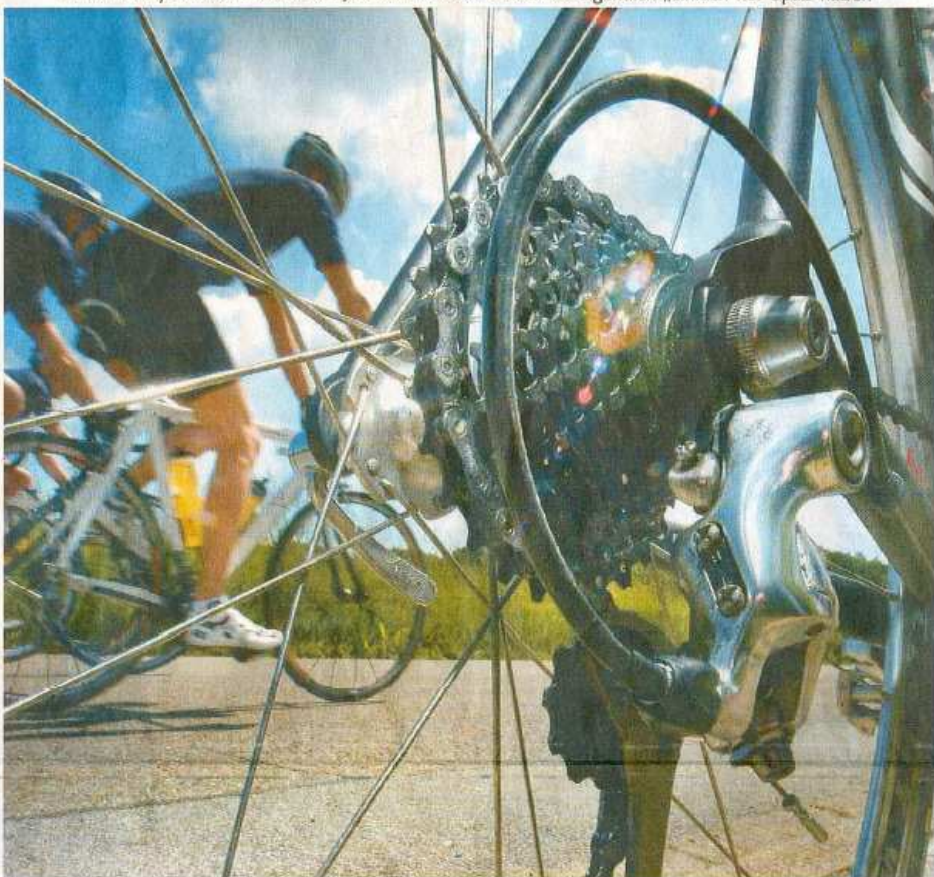
Die Ribzlkassette der Rennmaschinen sorgt für die reibungslose Umsetzung der 20 Gänge – Dringend notwendig, um auch bei anstehenden Bergetappen nicht aus dem Tritt zu kommen. Beim Gerolsteiner Radmarathon mussten die Essener 844 Höhenmeter überwinden.

10 000 Kilometer im Jahr – Für das „Cycling Team Essen“ ist kein Weg zu weit und kein Berg zu hoch. Neuer Hobby-Rennstall startet bei Jedermann-Rennen und will eigentlich „einfach nur Spaß haben“